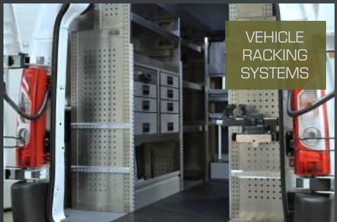
VEHICLE RACKING SYSTEMS