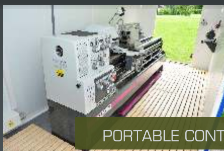
PORTABLE CONTAINER WORKSHOPS