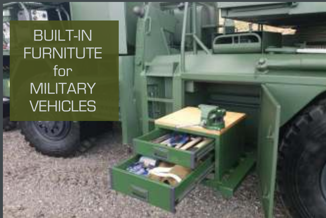
BUILT-IN FURNITURE for MILITARY VEHICLES