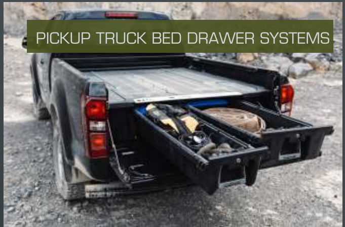
PICKUP TRUCK BED DRAWER SYSTEMS