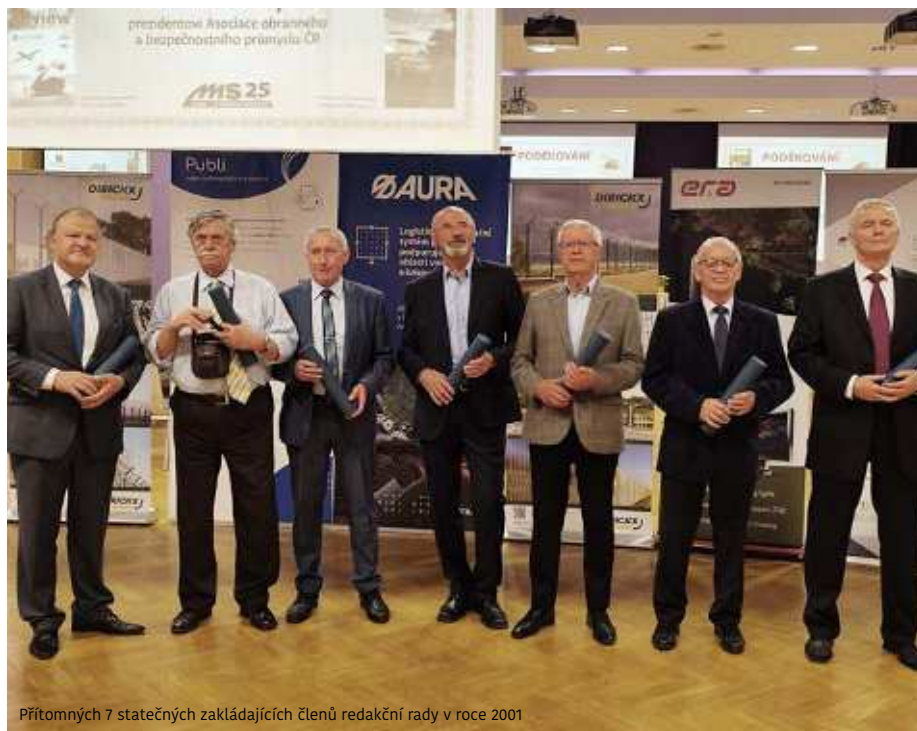
Přítomných 7 státních zakládajících členů redakční rady v roce 2001