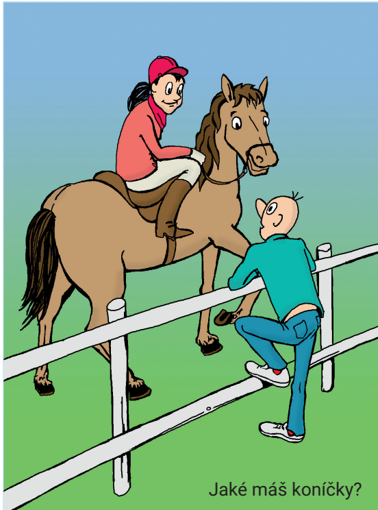
Jaké máš koníčky?