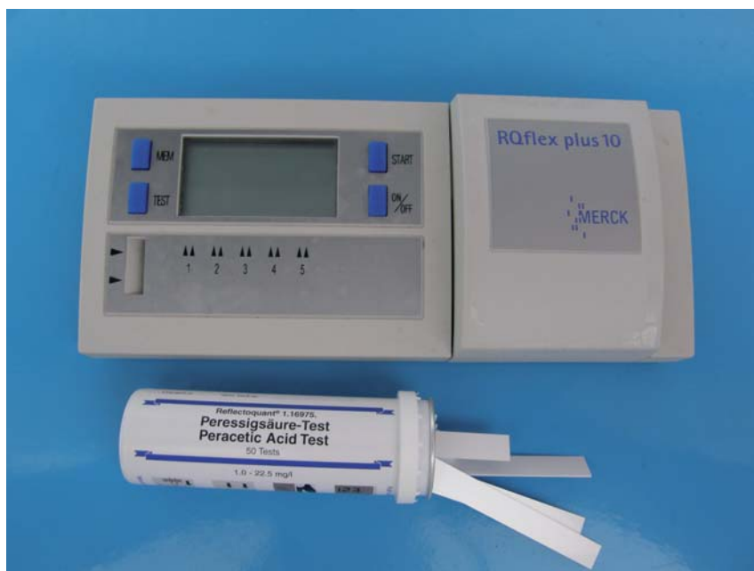
Obr. 2. Mobilní reflektometr RQflex® pro stanovení KPO pomocí jednorázových testovacích proužků.