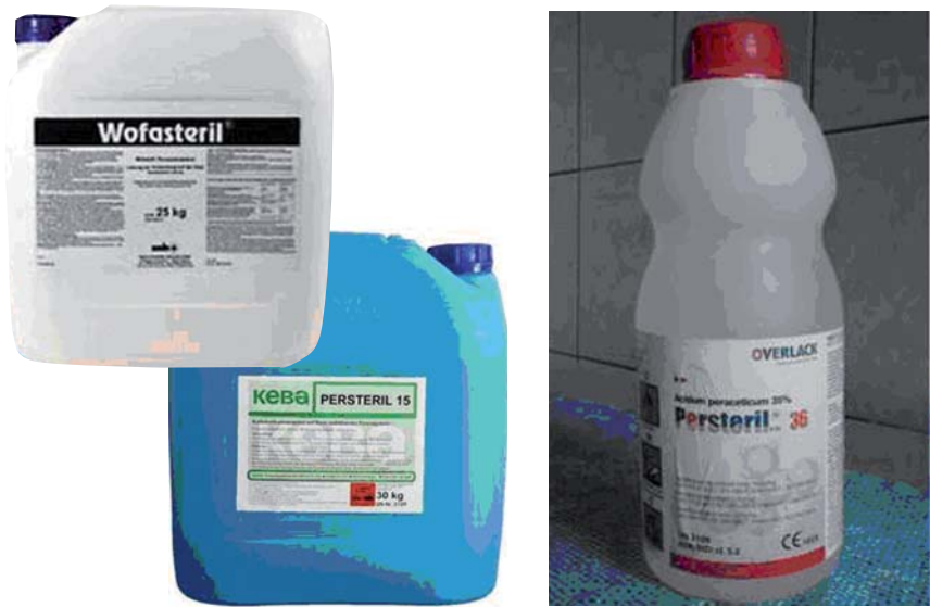
Obr. 1. Ukázka komerčních výrobků rozdílného objemu s obsahem kyseliny peroctové.