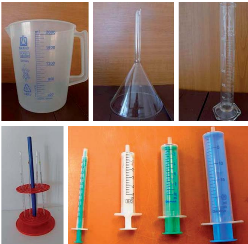
Obr. 5. Laboratorní odměrné nádoby

Při manipulaci s neředěným Persterilem se doporučuje používat štít nebo alespoň ochranné brýle!