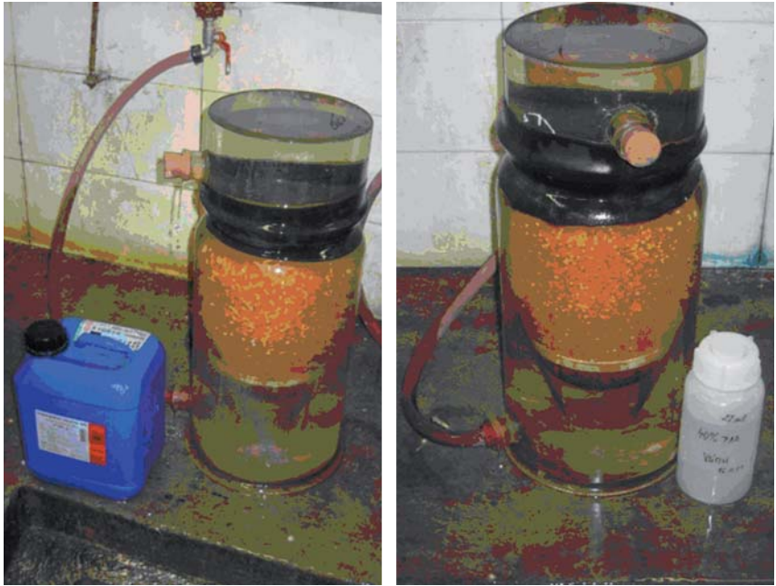
Obr. 3. Aplikace formalínu a KPO do inkubačních lahví s jikrami sivena amerického.